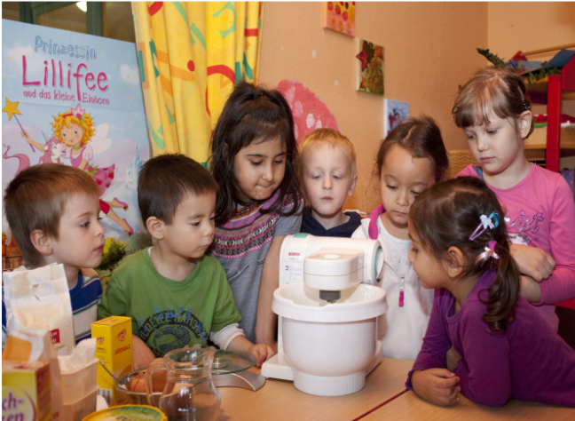
Jedes Kind ist eine eigenständige, ganzheitliche Persönlichkeit

Kinder sind unsere Zukunft. Sie beschenken uns durch ihre staunende Neugier und Liebe am Leben. Es liegt an uns, die kindliche Entwicklung zu unterstützen und die Wurzeln eines jeden uns anvertrauten Kindes zu pflegen, damit es zu einer verantwortungsvollen Persönlichkeit heranwächst.