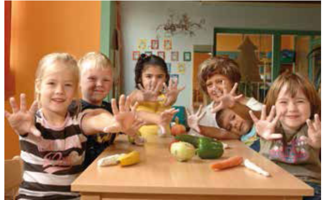
Gesundes Essen schmeckt richtig gut

Qualitätsstandard „Fit Kid-Plus Bio“ geeinigt und sind Fit Kid zertifiziert. Wir kochen täglich frisch in unserer modernen Küche. Wir verwenden saisonale und regionale Produkte mit einem hohen Bioanteil. Wir berücksichtigen religiöse, kulturelle und medizinische Besonderheiten der Kinder.