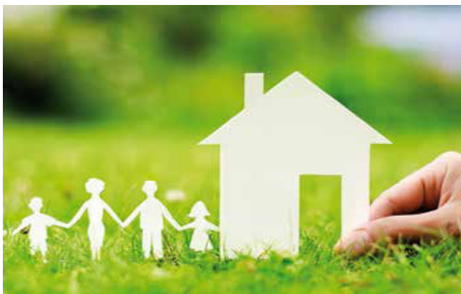
Ein Haus für die ganze Familie

FIT KID ist ein Konzept für die Kita Verpflegung und stellt sicher, dass Kinder rundum gut versorgt sind, weil es den Bedarf an allen Nährstoffen deckt, die Kinder für ein gesundes Wachstum, für ihre Entwicklung und Gesundheit brauchen. Neben der Familie ist unsere Kita ein zentraler Lernort für Essen und Trinken und leistet mit ihrem Verhalten einen großen Beitrag zu gesundheitsfördernden Maßnahmen und einem positiven Essverhalten der Kinder. Gesunde Ernährung ist damit ein Thema für die gesamte Kita, welches inhaltlich immer wieder aufgegriffen wird und sich in pädagogischen Projekten der Gruppen wiederfindet.